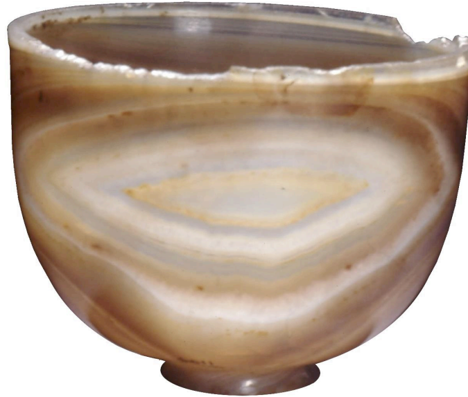
ILUSTRACIÓN 2: COPA DE ÁGATA. IMPERIO ROMANO. (S. I –II). BRITISH MUSEUM, LONDRES. TRATAMIENTO DIGITAL DE LA IMAGEN: CRISÁLIDA, VALENCIA. CORTESÍA DEL BRITISH MUSEUM.

En la tesis se muestra un ejemplo de copa de ágata de los siglos I – II d. C. expuesta en el Museo Británico. Por observación directa, se aprecia esta diferencia fundamental de elección de “tipo de corte” ente esta copa de ágata y el vaso superior del Santo Cáliz.