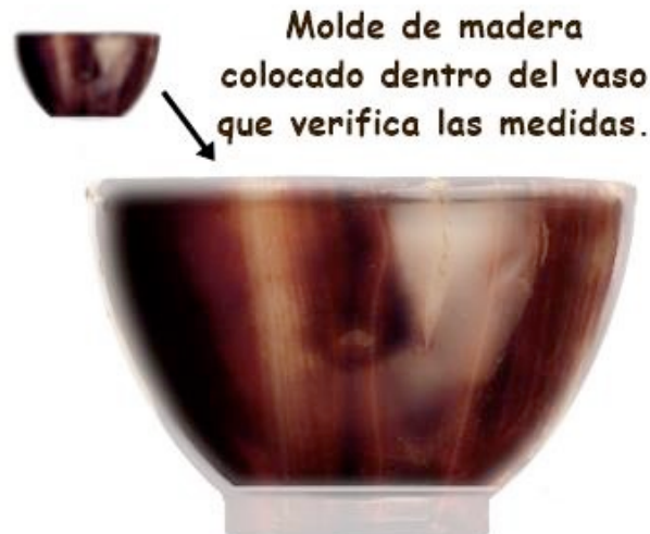
ILUSTRACIÓN 4: EJEMPLO VISUAL DEL POSIBLE PROCESO LLEVADO A CABO EN LA FABRICACIÓN DE LAS COPAS EN PIEDRA, PARA LA COMPROBACIÓN DE SUS MEDIDAS CONFORME A LA TRADICIÓN JUDÍA. IMAGEN: ANA MAFÉ GARCÍA.

Los dos primeros dedos la copa superior del Santo Cáliz representan un reviít , que es la cantidad mínima de ingesta de vino considerada adecuada para celebrar el Pésaj (Pascua en hebreo).